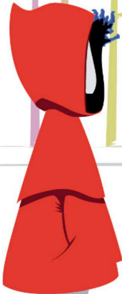
Illustration Sab Terner