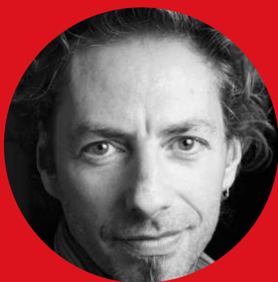
CYRIL RIPOLL COMEDIEN