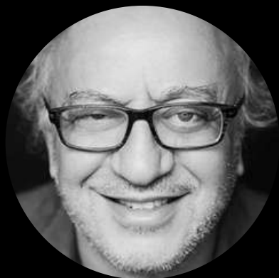
MOHAMED GUELLATI METTEUR EN SCÈNE

Acteur, auteur ou metteur en scène depuis 1990