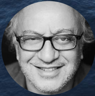
MOHAMED GUELLATI METTEUR EN SCÈNE

Acteur, auteur ou metteur en scène depuis 1990